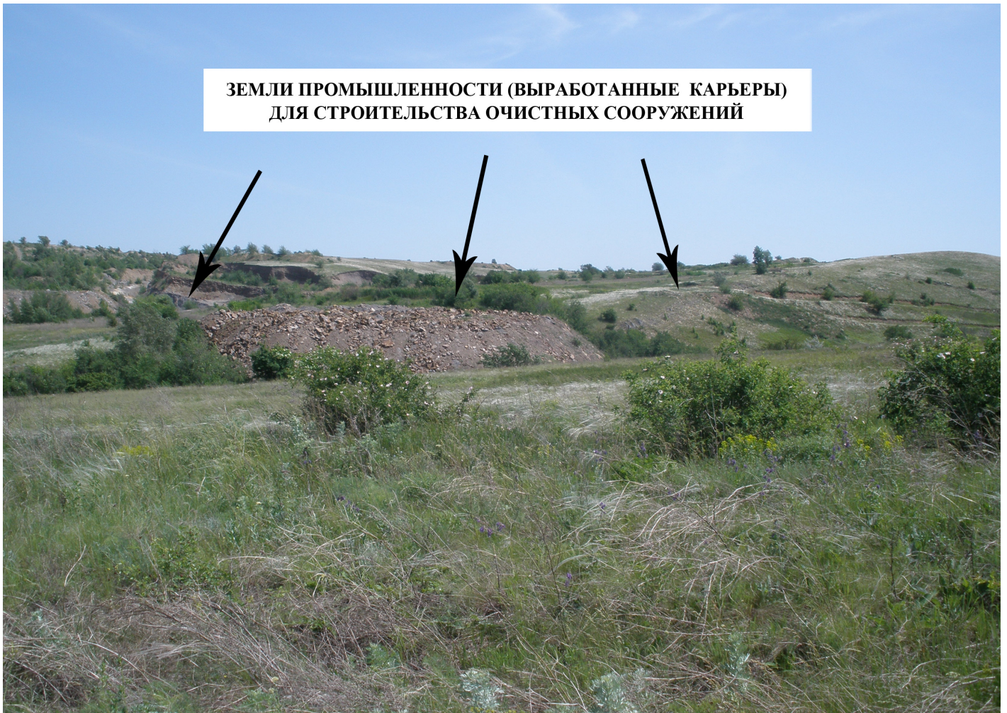
ЗЕМЛИ ПРОМЫШЛЕННОСТИ (ВЫРАБОТАННЫЕ КАРЬЕРЫ) ДЛЯ СТРОИТЕЛЬСТВА ОЧИСТНЫХ СООРУЖЕНИЙ