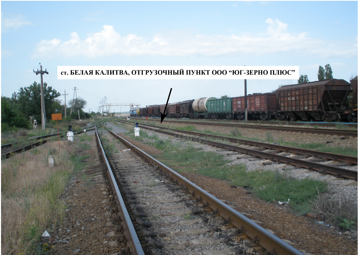
ст. БЕЛАЯ КАЛИТВА, ОТГРУЗОЧНЫЙ ПУНКТ ООО “ЮГ-ЗЕРНО ПЛЮС”